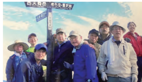
東天狗岳の頂上にて

9月20~21日、9名が八ヶ岳の天狗岳(2,645m)に登ってきました。20日は桜平から夏沢峠にある山びこ荘(2,440m)までを2時間30分で到着し、夕食後には窓辺の餌場にモモンガが来て心を和ませてくれた。早めに就寝。夜中3時ごろ目覚め、外に出ると冷える。満天の星。21日は6:25出発。樹林帯の中をゆっくり登り、箕冠山・根石岳を登り下りして高度を上げ、東天狗岳の頂上には8:10に到着。360度の展望が望め、槍・穂高連峰、名前の分からない山々が雲海の上に見られる。富士山は方向性が悪く見えず。45分後には下山開始。夏沢鉱泉でラーメンを食べ、12:40に下山終了。天候に恵まれた山行であり、全員無事に帰ることが出来、なによりでした。