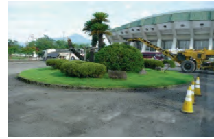
2015/8/8 移設の為、撤去作業開始