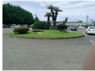
2015/7/3 現地状況確認 会長・幹事 越前市都市計画課職員と

先だつての会長挨拶で触れました、ロータリーの庭が撤去、移設されましたので、写真でご紹介しておきます。ご覧下さい。宜しくお願いします。