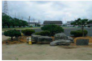
仮置き場 体育館東横グラウンド