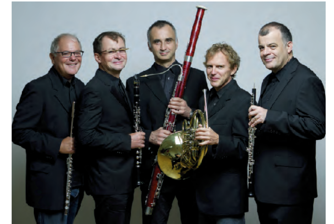
スローウインド木管五重奏団

スローウインドは、スロヴェニア・フィルハーモニー管弦楽団のソリスト達によって結成された木管五重奏団である。彼らは、本国スロヴェニアと海外で木管五重奏曲のスタンダードを演奏するだけでなく、世界的に著名な演奏家たちとの共演を通じ、室内楽の多様な音域にも挑戦している。特にこのことは現代音楽の分野で顕著で、彼らはとても重要な現代音楽祭の常連である。彼らの功績が讃えられ、1999年にリュブリャナ市からジュパンチッチ賞を、2003年に権威のあるプレシエレン基金賞(文化部門)を本国スロヴェニアから贈られている。