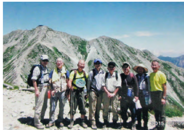
立山・雄山をバックに

8月9日(日)、連日猛暑が続く中、避暑を兼ねて10名が立山に行ってきました。雄山には幾度も登っているので、今回は方向を変えて室堂から浄土山(2,831m)に登り、一ノ越から室堂に到着するコースとしました。分岐から頂上までは岩のゴロゴロした急登で、大変難儀しました。快晴で、剣岳・雄山・大日岳・薬師岳はもちろん遠くに槍穂高連峰・白山・笠ヶ岳・後立山連峰の峰々も見事にみられました。