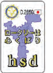
2014-2015 第2650地区テーマ ロータリーは心くぼり