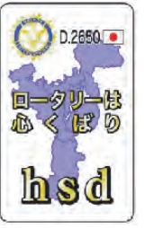
2014-2015 第2650地区テーマ ロータリーは心くばり