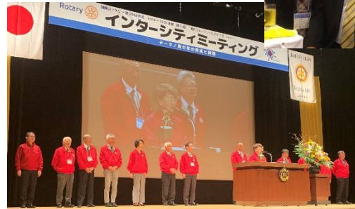
次年度 IMホスト勝山 RC